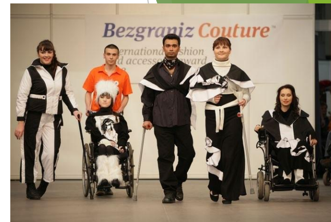
2012 - выпускники «Школы» представляют коллекции в Москве