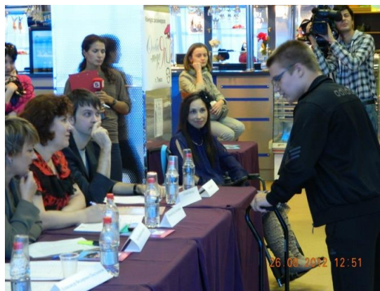
2012 - открытие уникальной в России «Школы моделей с инвалидностью»