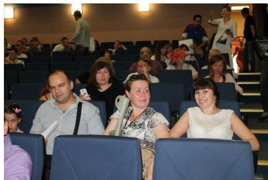
2015 – премьера документального Фильма о «Проекте»