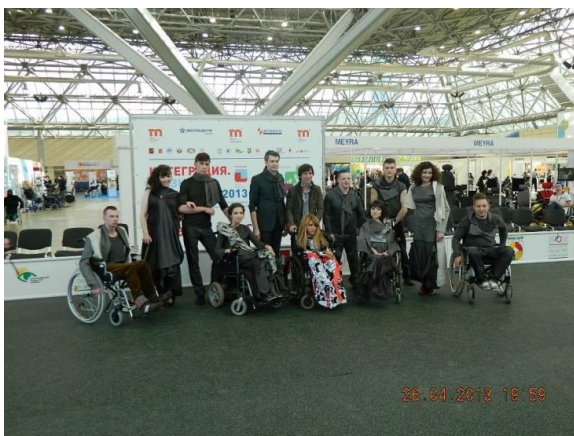
2013 – Проект стал Межрегиональным