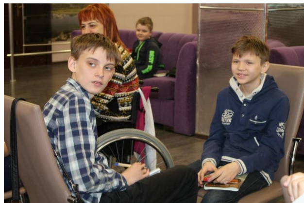
Занятия с психологом