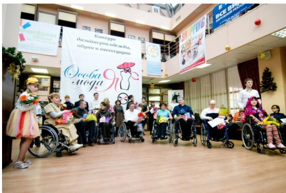
2011 - Первый конкурс «Особая мода»