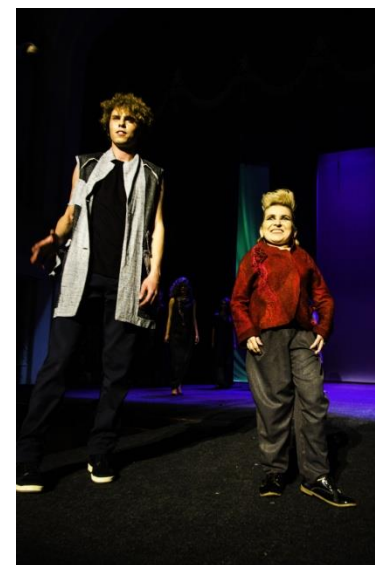
2017 – Проект вышел на Всероссийский уровень