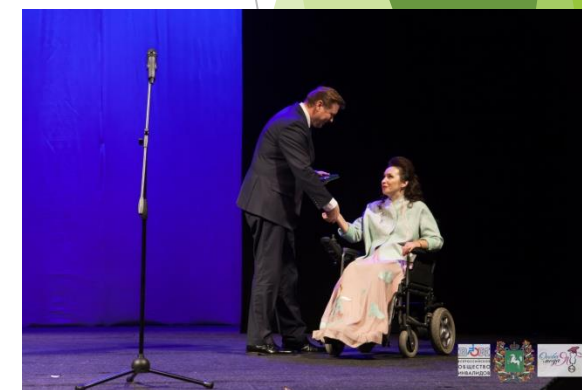
2018 – Проект стал Международным